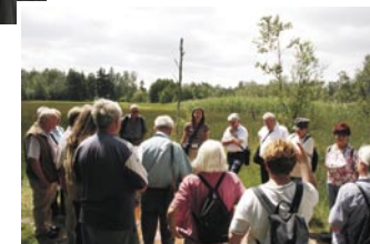
Mit im Programm: Fahrten nach Böhmen.

den Touristinfos gerne auch ein Rundumpaket für Ihren Aufenthalt im Gebiet des Bayerisch-Böhmischen Geoparks, darunter Tagesfahrten sowohl in Bayern als auch in Böhmen. Rufen Sie uns an!