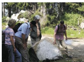
Besuch im Steinbruch

Mit einem Geoparkranger den Geopark zu durchstreifen, heisst, Landschaft, Steine und Natur einmal unter einem ganz anderen Blickwinkel zu betrachten und dabei Erstaunliches zu entdecken. Vulkane im Fichtelgebirge? In der Oberpfalz? Bayern einst am Südpol und am Äquator? Woher kommen die Gesteine und wie alt sind sie eigentlich? Gab es bei uns Dinosaurier? Dies und vieles mehr erfahren die Teilnehmer auf einer der zahlreichen Geo-Touren im Geopark. Und immer auch Interessantes zur Kulturgeschichte.