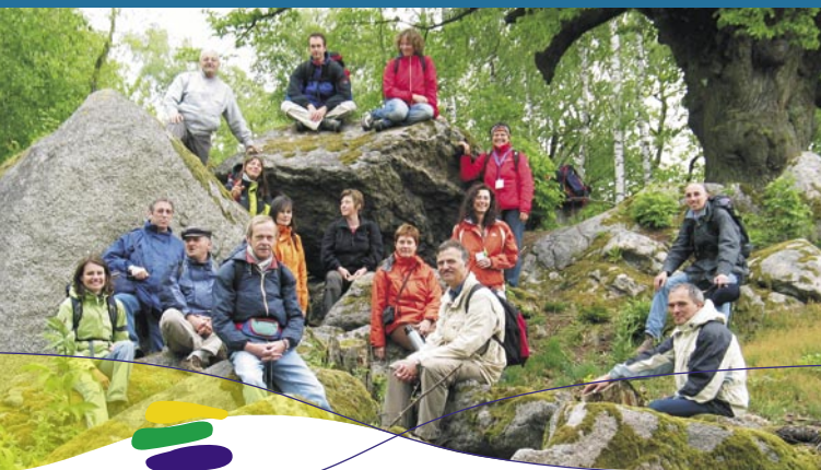
Eine starke Truppe: die Geoparkranger