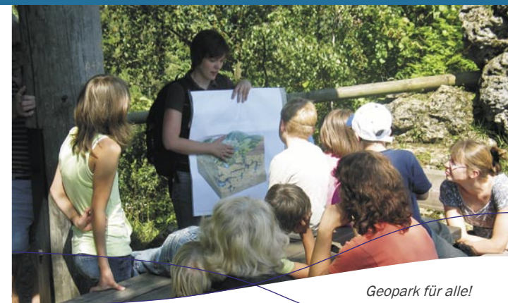
Geopark für alle!