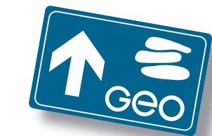
Wegemarkierung des GEO-Erlebnisweges „Historischer Zinnbergbau am Rudolfstein bei Weißenstadt“

Die Blütezeit des Zinnabbaus in Weißenstadt war bereits Mitte des 15. Jhdts. vorbei, doch gab man das Schürfen nach Zinnerzen bis in das 20. Jhd. hinein nie auf.