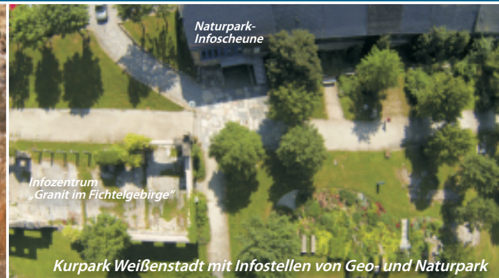
Naturpark-Infoscheune Infozentrum „Granit im Fichtelgebirge“ Kurpark Weißenstadt mit Infostellen von Geo- und Naturpark