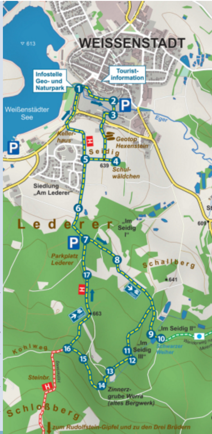
© OpenStreetMap – Mitwirkende | Gestaltung durch GEOPARK Bayern-Böhmen 2015

Einen informativen Rundgang und angenehmen Aufenthalt wünschen Ihnen die Stadt Weißenstadt und der GEOPARK Bayern-Böhmen.