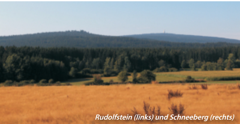
Rudolfstein (links) und Schneeberg (rechts)