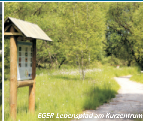
EGER-Lebenspfad am Kurzentrum