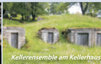
Kellerensemble am Kellerhaus

men Deutschlands, der GRASYMA (= Vereinigte Fichtelgebirgs-, Granit-, Syenit- und Marmorwerke AG).