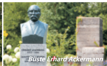
Büste Erhard Ackermann